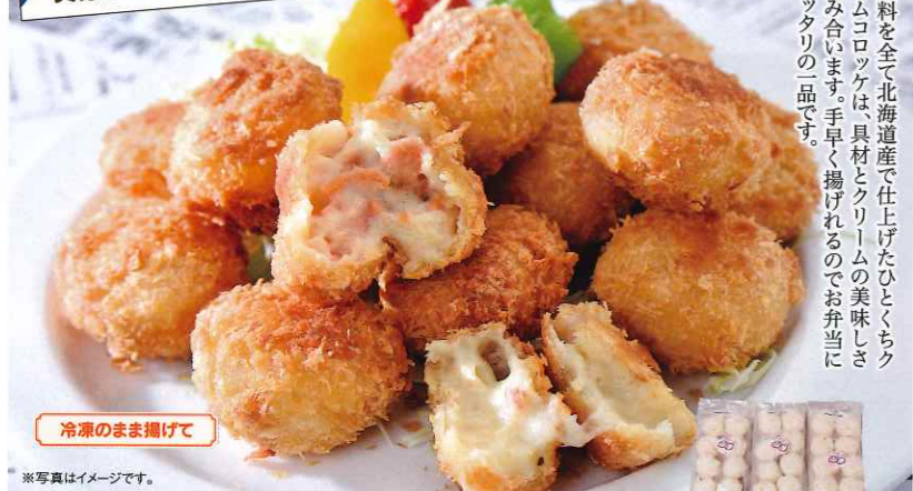
冷凍のまま揚げて