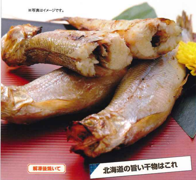
解凍後焼いて 北海道の旨い干物はこれ